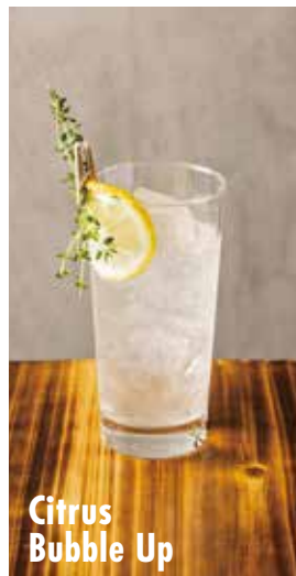
Citrus Bubble Up

シトラスバブルアップ 890 オリジナルレモンシロップと タイム香る、華やかなカクテル