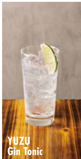
YUZU Gin Tonic

オリジナル サングリア Glass 860 Carafe 2,600 ロッソ・ピアンコ