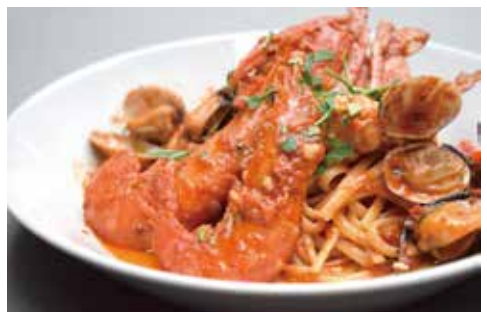
LINGUINE PESCATORE WITH HEARTY SEAFOOD