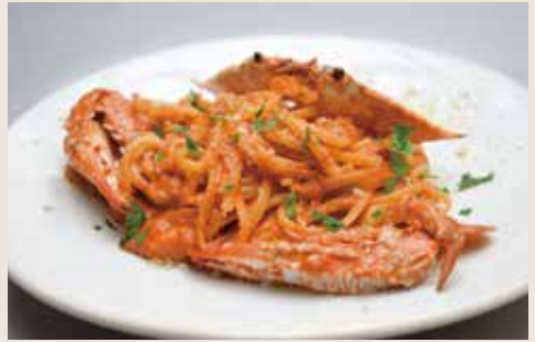
LINGUINE WITH CRAB, TOMATO CREAM SAUCE