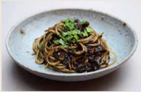
SQUID INK SPAGHETTI