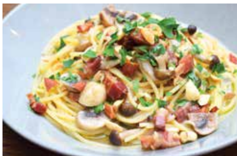
SPAGHETTI PEPERONCINO WITH BACON, MUSHROOM, NUTS