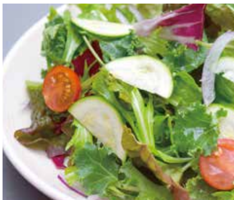
GARDEN SALAD WITH LEMON DRESSING ガーデンサラダ BAR風レモンドレッシング ¥780