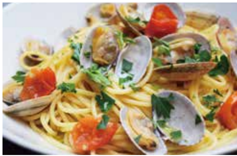
SPAGHETTI VONGOLE WITH CHERRY TOMATO