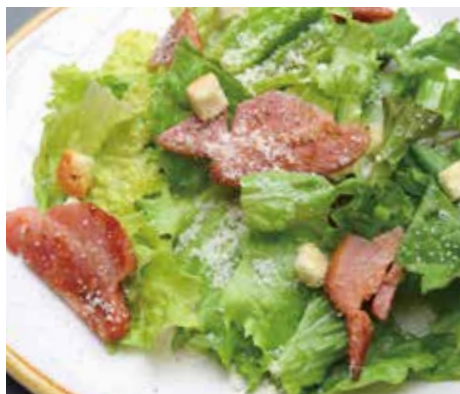
CAESAR SALAD 炙りベーコンのシーザーサラダ ¥880