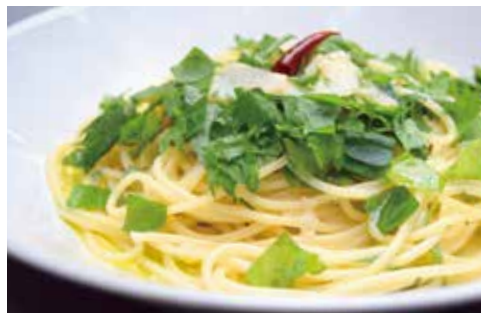
SPAGHETTI PEPERONCINO WITH JAPANESE BASIL