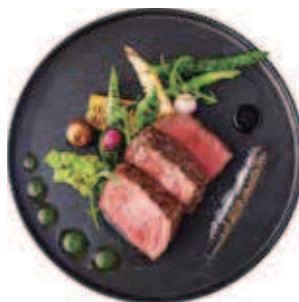
CHARCOAL-GRILLED JAPANESE BEEF