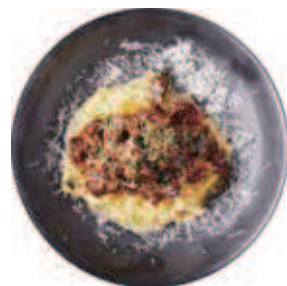
FRESH PASTA TAGLIOLINI WITH MEAT SAUCE