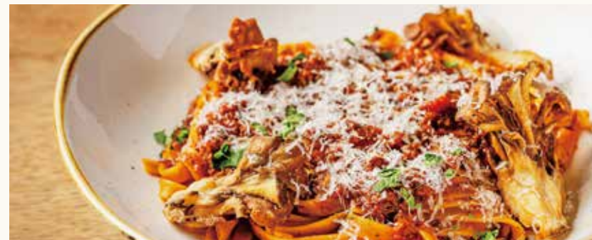
Fettuccine with Stewed Shinshu Wagyu Sauce, Deep Fried Maitake Mushrooms 2,180

信州のキノコとトリュフの贅沢なカルボナーラ。一口食べれば、その香りと旨味に魅了される一品