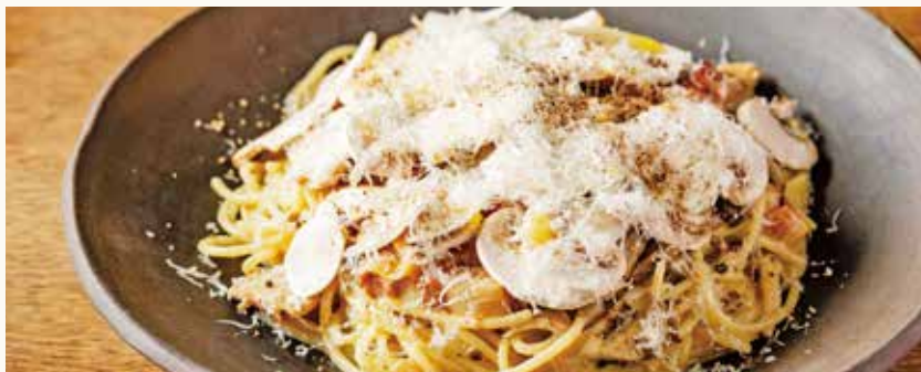
Spaghetti Carbonara with Shinshu Mushrooms and Truffle 1,880