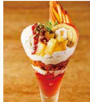
Apple Compote Parfet

じっくり火を入れたりんごのコンポートとバニラジェラートの鉄板の組み合わせ。アマレーナソースが絶妙なアクセントに