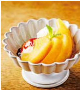
Apple Compote with Vanilla Gelato 730 (803)